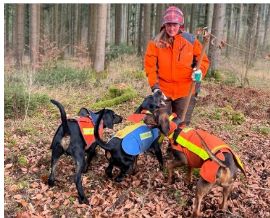
Bild 14 Erste Drückjagdeinsätze als Stöberhund, ideal mit erfahrenen Hunden zusammen

Parallel zu allen hormonellen Schwankungen stellen wir uns der Aufgabe aus dem Pubertier einen vollwertigen Jagdhund zu machen. Vorbereitend auf die Brauchbarkeitsprüfung werden die Übungsfächer Gehorsam, Schussfestigkeit (Anhang 3), Standruhe (Anhang 3) und Schweißarbeit (Anhang 2) trainiert, alternativ oder parallel zur Schweißarbeit das Stöbern.