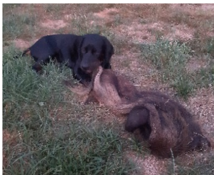
Bild 8 Am Ende der Futterschleppes erhält der Welpen ausreichend Zeit zum Spiel mit der Sauschwarte

ist ruhig bestimmt und konsequent, weder grob (brutal) noch hysterisch (laut). Eine regelmäßige Unterordnung ist ein wichtiges Übungsende. Was „Hänschen“ jetzt leicht akzeptiert, wird in der Pubertät ein wertvoller Baustein, damit aus „Hans“ nicht „Herkules“ wird (vgl. Bild 7). Die Rudelmitglieder machen es ganz selbstverständlich.