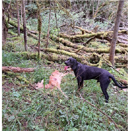
Bild 12 Erfolgreiche Hetze auf einen schwer kranken Rehbock

Viel Beschäftigung festigt die Bindung und kanalisiert die vorhandene (überschüssige) Energie in sinnvolle Bahnen. Je mehr Auslastung dem jungen Hund geboten wird, desto entspannter kann er daheim sein. Eine Stunde spazieren gehen an der (kurzen) Leine stellt dabei keine Auslastung dar! Kopf und Körper müssen gleichzeitig gefordert werden. Ein abwechslungsreiches Training, mit regelmäßiger Möglichkeit sich frei zu bewegen, sorgt für Zufriedenheit beim Hund und so auch beim Halter.