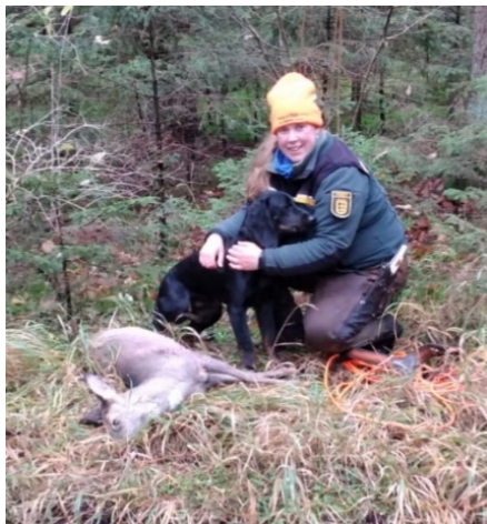
Bild 13 Erste kurze Totsuchen

Was haben sie erwartet? Sie leben mit einem hierarchisch strukturierten Raubtier zusammen! Stuhlkreise stehen weder bei Wölfen noch bei Hunden hoch im Kurs. Hunde diskutieren nicht miteinander, sie kämpfen Konflikte offen aus. Fallen sie also nicht aus allen Wolken, wenn ihr Pubertier sie anknurrt, sondern reagieren sie angemessen, ruhig und bestimmt (nicht hysterisch oder brutal). SIE müssen in dieser Lebensphase des Hundes die Rangordnung vorgeben und konsequent einfordern! Knurrt der Hund sie an (z.B. vom Sofa aus = erhöhte Position), schieben sie ihn einfach runter bzw. weg (zur Not mit einem Besen), und schicken sie ihn an einen Platz ihrer Wahl (Decke, anderes Zimmer). Wer bewegt führt! Soll heißen, weichen sie vor ihm zurück hat er „gewonnen“, weicht er zurück Sie. Wir erwarten von unseren Jagdhunden das sie, ohne zu zögern an 100 kg schweren Wildsauen jagen. Dieses Selbstbewusstsein haben sie auch daheim im Rudel. Wenn die Teenager sich ausprobieren, müssen sie dagegenhalten. Fordern sie konsequent ihre Position ein: z.B. geht der Rudelchef/In zuerst durch die Tür, er/sie bestimmt wer, wann, wo liegt oder frisst!