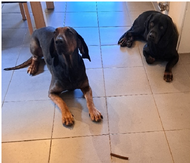
Bild 20 nach dem Kommando Meins abwarten auf das Nimm

Zu Beginn der Übung wird der Hund mit dem Kommando Platz abgelegt. Dann legen wir ein Leckerli vor seine Nase und achten darauf, dass er es nicht frisst. Hierzu legen wir anfangs die Hand darüber. Wenn der Hund uns anschaut und die Konzentration weg vom Leckerli auf uns lenkt, dann bekommt er es. Unterstützen können wir die Übung mit den Kommandos „Meins“ und „Nimm“. Die Schwierigkeit wird dabei allmählich gesteigert, bis sie problemlos auch aus dem Zimmer gehen können oder/und der Hund neben dem Leckerli steht.