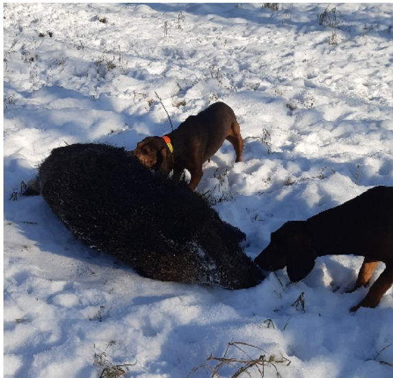
Bild 16 Im Team geht es leichter: der junge Hund (rechts) lernt vom erfahren (links) wann zugepackt werden kann oder wann Abstand geboten ist

Aus dem Junghund wird langsam ein Erwachsener, sowohl geistig als auch körperlich.