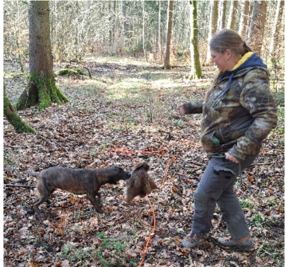
Bild 9 Auch am Ende der Übungsfahrte, Spiel und Spaß mit der Sauschwarte

In der Hundeschule lernt der Welpen neben dem sozialen Spiel mit den Artgenossen auch den Gehorsam unter Ablenkung. Die Spielpartner sollten möglichst verschieden sein, auf kleinere Artgenossen muss er Rücksicht nehmen, bei den großen Zurückhaltung üben. Von Pinscher bis zum Neufundländer darf und sollte alles dabei sein.