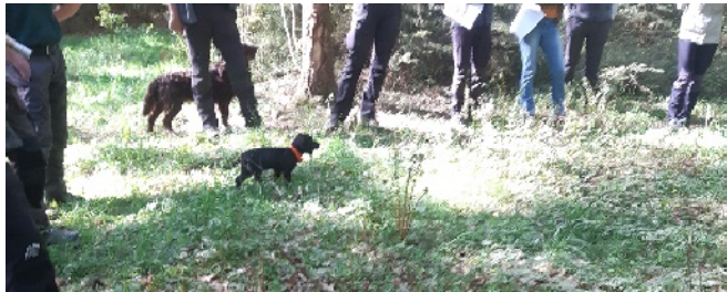
Bild 6 Auf dieser Exkursion lernt der Welpen Menschen und Hunde kennen (wo immer möglich nehmen wir den Welpen mit)

Erste Besuche in der Welpengruppe der Hundeschule fördern das Sozialverhalten.