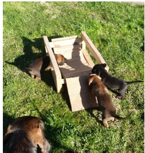
Bild 2 Spiel mit den Geschwistern im Garten ab der 4. Lebenswoche

Ab der 4. Woche entdecken die Welpen die Welt außerhalb der Wurfkiste. Dabei lernen sie vor allem durch Nachahmen von Mutter, Geschwistern und Rudelmitgliedern. Sie nehmen Umweltreize wahr und entwickeln im Spiel Muskeln und Charakter.