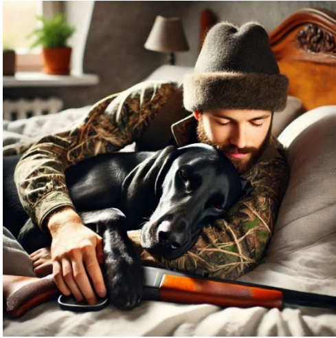
Bild 11 Vorstellung des Hundeführers

In der Pubertät driften Wunschvorstellung des Hundeführers und Denke des Pubertiers oft weit auseinander.