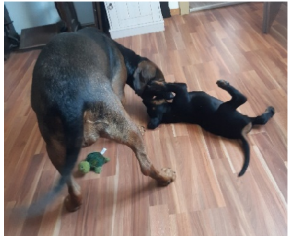
Bild 7 Unterordnung im Spiel mit Mama, auch sie zeigt deutlich Grenzen auf