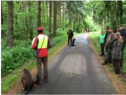
Bild 14 Übung zur Standruhe bei einem Prüfungsvorbereitungskurs

Wiederholen Sie die Übung, bis der junge Hund es aushält, dass in kurzer Entfernung mehrere laut lärmende Treiber vorbei gehen und mehrere Schüsse in kürzerer Distanz (ca. 30m) fallen. Ganz „echt“ bzw. vergleichbar mit der Prüfungssituation wird die Übung, wenn rechts und links neben Ihnen auf dem Waldweg noch mind. 1 weiterer Hund Bei Fuß sitzt oder im Platz liegt.