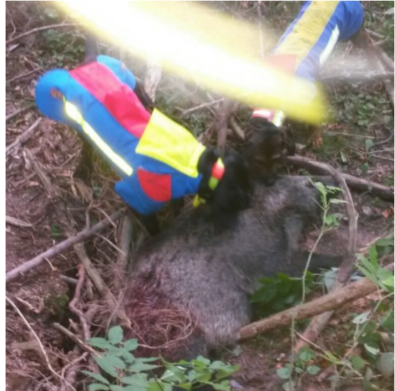
Bild 13 Königsdisziplin: 2 erfahrene Hunde haben die Sau mit Keulenschuss erfolgreich gebunden

Kynologisch gesehen gehören Bracken zu den Laufhunden, und sind neben den sogenannten Urhunden die selbständigsten unter den Hunden. Sie sind gezüchtet eigene Entscheidungen zu treffen und umzusetzen (z.B. Hetze abbrechen oder fortsetzen). Deshalb gelten sie als eigensinnig, stur und schwer auszubilden. Vorsteh- oder Schäferhunde sind eine ganz andere Hausnummer, sie wurden auf die Zusammenarbeit mit dem Menschen hin gezüchtet. Die Bracken hingegen auf die Fähigkeit selbständig Probleme zu lösen.