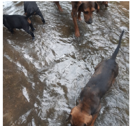
Bild 4 im Wasser mit Mama 7. Woche