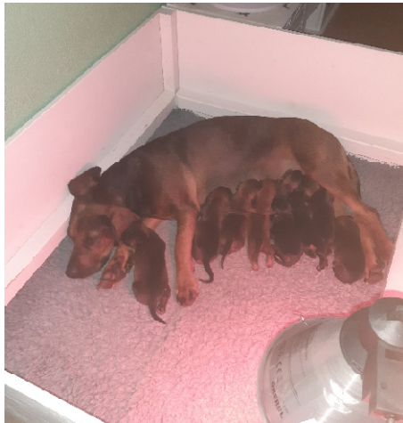
Bild 1 In der Wurfkiste bei Mama

Die ersten drei Wochen ihres Lebens verbringen die Welpen in der Wurfkiste mit ihrer Mutter. Schlafen, trinken, schlafen bestimmt den Rhythmus. Die Hündin säugt die Welpen, putzt und umsorgt sie. Geboren werden die Welpen blind und taub, Augen und Ohren öffnen sich etwa zwischen dem 10. und 14. Lebenstag.