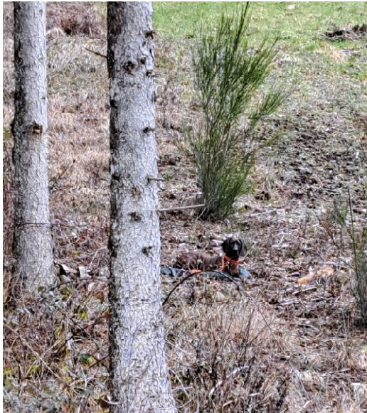
Bild 21 frei auf der Jacke abgelegt, wartet der junge Hund, bis er abgeholt wird

Die Zeitspanne wird allmählich verlängert und auch die Distanz zum Hund vergrößert. Der Hund ist erst angebunden, dann angeleint (Leine lose am Boden) und später frei.