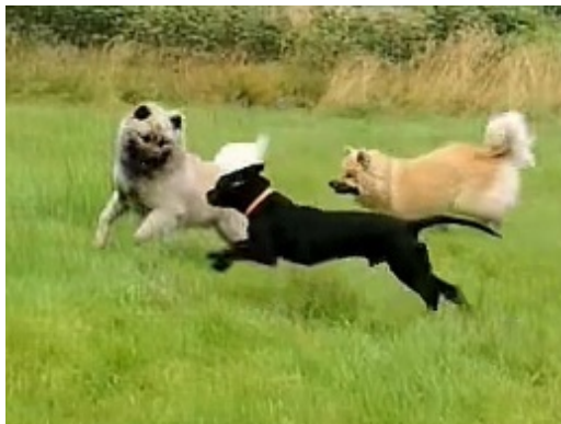
Bild 10 Spiel mit möglichst vielen, verschieden Hunden

Flügelhaftigkeit, Frechheit, Trotz und Ungehorsam – gibt es nicht nur bei pubertierenden Menschen! Auch die Pubertät unserer heranwachsenden Hunde stellt viele (erschöpfende) Herausforderungen an den souveränen Hundeführer/In.