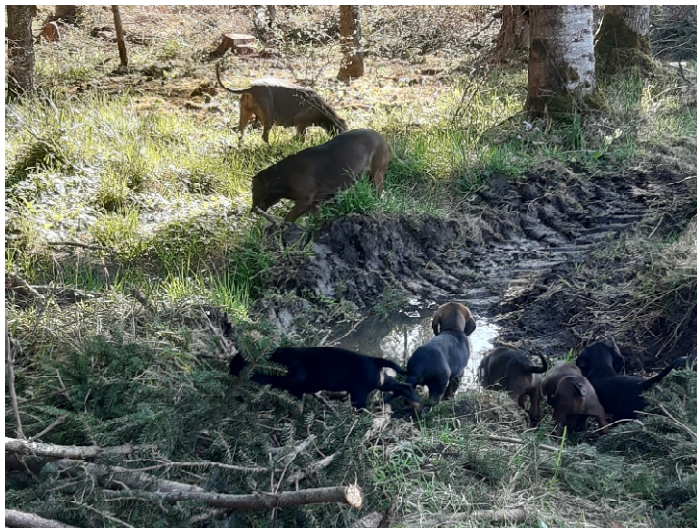
Bild 3 die Welpen entdecken den Wald in der 6. Woche